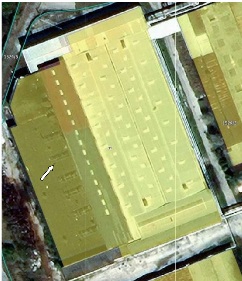
– Локација постојећег хангара уз објекат старог Пресераја –

Хангар уз објекат старог Пресераја (део објекта број 11) вањских габарита око 70мх12м је планиран да се руши и на локацији постојећег објекта планирана је изградња новог објекта - магацин робе из кооперације. Објекат је планиран са монтажном конструкцијом (челична конструкција или бетонски префабриковани елементи) и зидним и кровним панелима.