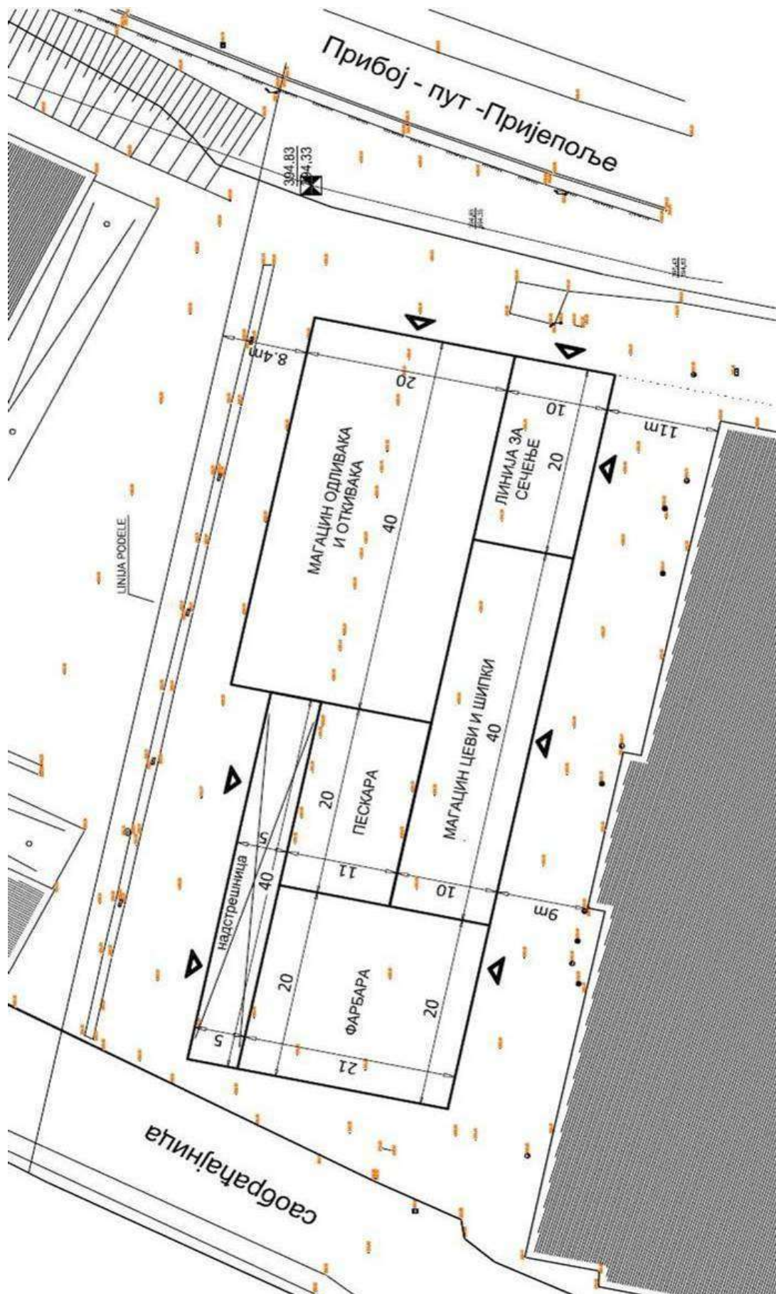
- Локација нових објеката на платоу између хале машинске обраде и постојеће фарбаре (фарбара, пескара, надстрешница, магацин одливака и откивака, магацин цеви и шипки и линија за сечење материјала) -